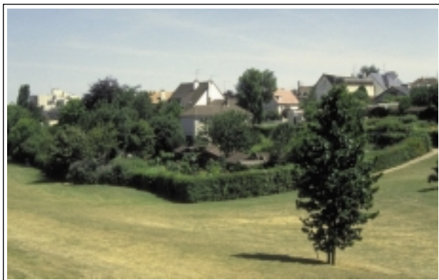
ECB-LFCTF - Haies et arbres permettent l'appropriation et l'intégration paysagère du groupe de jardins avec l'espace public dans lequel il est implanté.

Les plantations d'arbres et de haies permettent une meilleure évolution du jardin nouvellement créé ou réaménagé, évolution nécessaire à l'appropriation du site par ses protagonistes. L'arbre recouvre plusieurs fonctionnalités : élément de relief vertical structurant l'intérieur du groupe (rôle d'espace tampon, marquage de limites) avec l'environnement extérieur en assurant une transition entre urbanisme minéral et jardins, fonction d'embellissement, rôle rafraîchissant de son ombrage, production fruitière ou matière à tuteur et compost (feuillage d'automne).