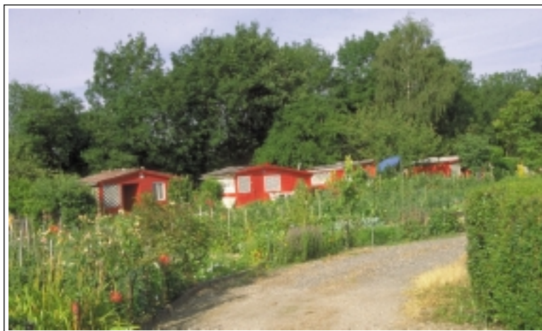
ECB-LFCTF - Un bel exemple réussi : harmonisation collective, tout en conservant la créativité individuelle (Ecully, près de Lyon).

La couleur a aussi une place importante dans l'appréhension du groupe de jardins. Pour exemple, sur un site ancien de Jardins Familiaux à Ecully (près de Lyon) on a délibérément décidé de repeindre en rouge vif les cabanons hétéroclites. Loin de choquer, cette couleur vive et inattendue se marie au vert dominant des feuillages.