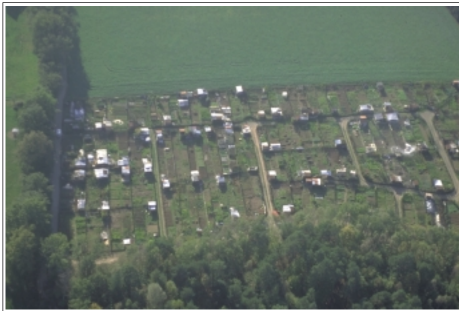
JDA - Image d'un groupe de jardins, paysage de village

Chaque parcelle de jardin familial est une œuvre originale créée à partir d'éléments communs à tous : un lopin de terre, très souvent un petit abri, une treille, un châssis, une grosse part de cultures vivrières et souvent un coin bouquetier. Le tout est délimité par une clôture protectrice ou une simple marque d'intimité.